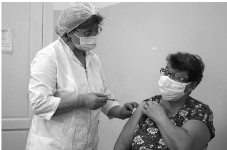
В прививочном кабинете участковой больницы.

На прививку с собой нужно взять паспорт, полис и СНИЛС -