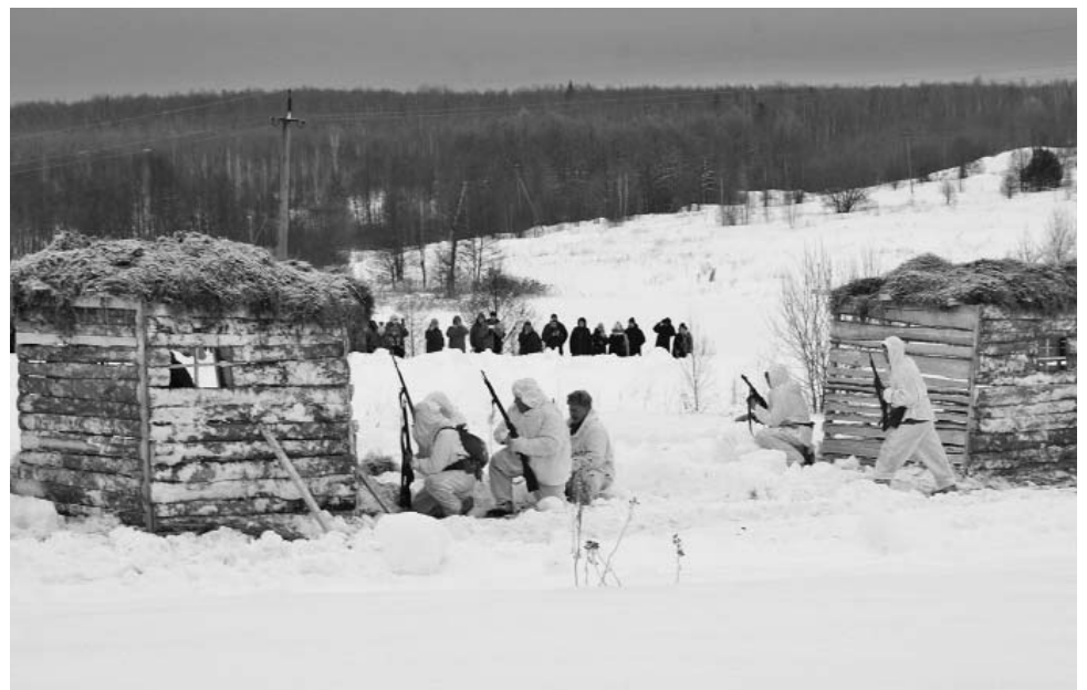
Памятные мероприятия, посвященные 80-летию подвига чекистов-лыжников у деревни Хлуднево, сопровождалась военно-исторической реконструкцией.